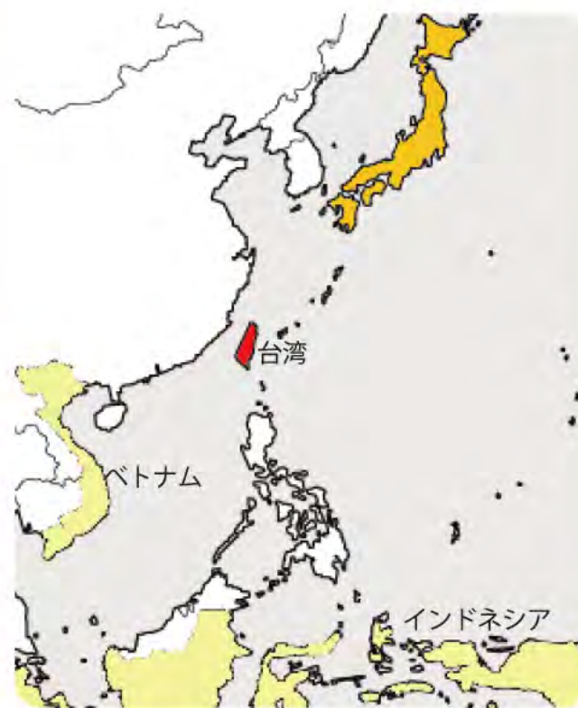
●台湾のデータ（中華民国）